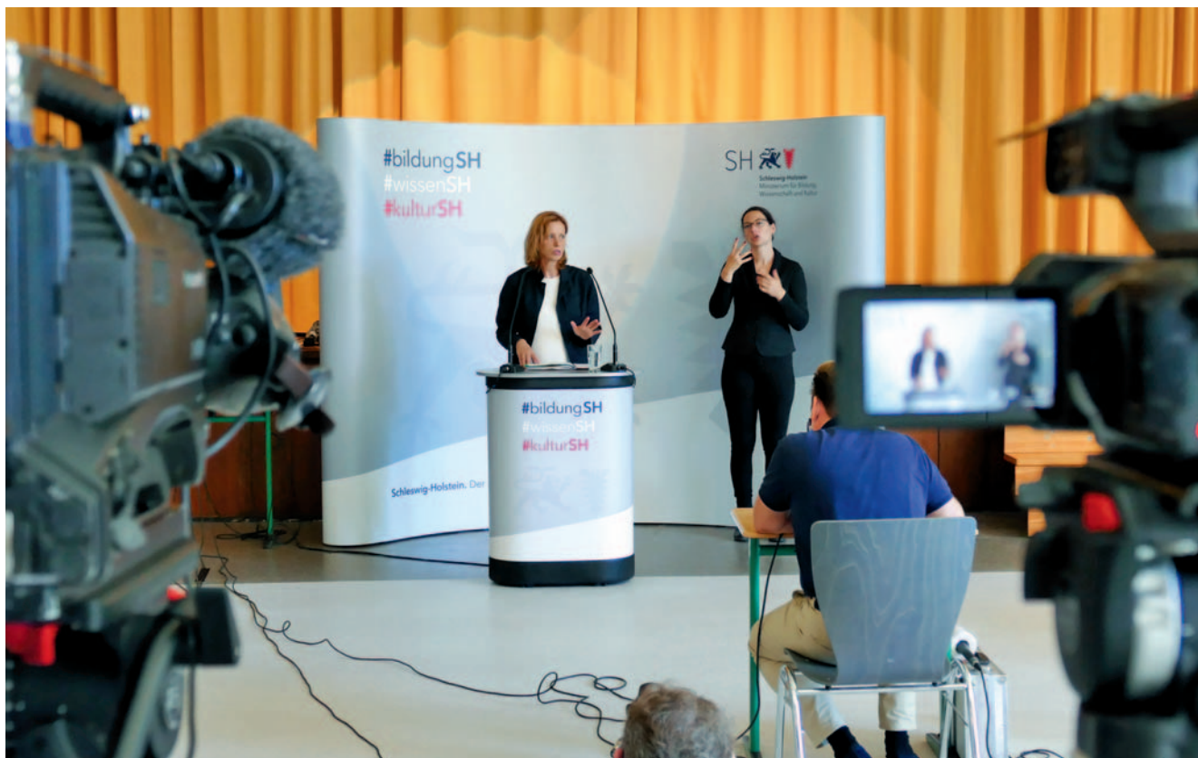
Bildungsministerin Karin Prien erläuterte bei der Pressekonferenz zum Schuljahresbeginn das Konzept der Schulen.

notwendig. Das ist die Aufgabe der Arbeitsmedizinerin im Bildungsministerium. Sie prüft sehr sorgfältig nach den Empfehlungen des Bundesministeriums für Arbeit und Soziales und den jeweils aktuellen Bewertungen des Robert-Koch-Instituts jeden Einzelfall. Berücksichtigt werden auch die schulische Gefährdungsbeurteilung und das Infektionsgeschehen in Schleswig-Holstein.