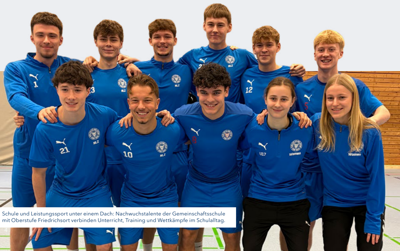
Schule und Leistungssport unter einem Dach: Nachwuchstalente der Gemeinschaftsschule mit Oberstufe Friedrichsort verbinden Unterricht, Training und Wettkämpfe im Schulalltag.

Kiel denkt olympisch. Mit der Unterstützung für eine mögliche Ausrichtung olympischer Wettbewerbe rückt auch das in den Blick, was weit vor einer Eröffnungsfeier beginnt: die Förderung junger Talente. Denn Spitzensport entsteht nicht erst im Erwachsenenalter, sondern häufig bereits im Kindes- und Jugendalter – und damit in einer Lebensphase, in der Schule, Training, Wettkämpfe, Prüfungen und persönliche Entwicklung gleichzeitig bewältigt werden müssen. Für Schulen ergibt sich daraus eine besondere Aufgabe: Sie müssen Bildungswege offenhalten und zugleich Rahmenbedingungen schaffen, in denen sportliche Entwicklung verlässlich möglich bleibt.