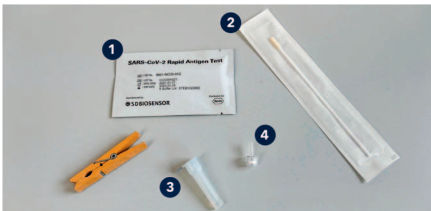
Ein Corona-Schnelltest besteht aus 4 Teilen: ① Ein Test-Kit, verpackt in einem Verpackungsbeutel. ② Ein Wattestäbchen einzeln verpackt in Folie. ③ Ein Röhrchen mit Testflüssigkeit. ④ Eine Spenderkappe, die auf das Röhrchen passt.

Ganz wichtig: Ein positives Ergebnis eines Selbsttests ist noch kein positiver Befund für eine COVID-19-Erkrankung.