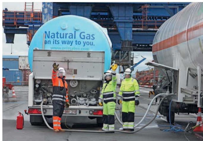
Brunsbüttel ist „LNG ready“: LKW-Bahn-Testumschlag am 25. April 2016