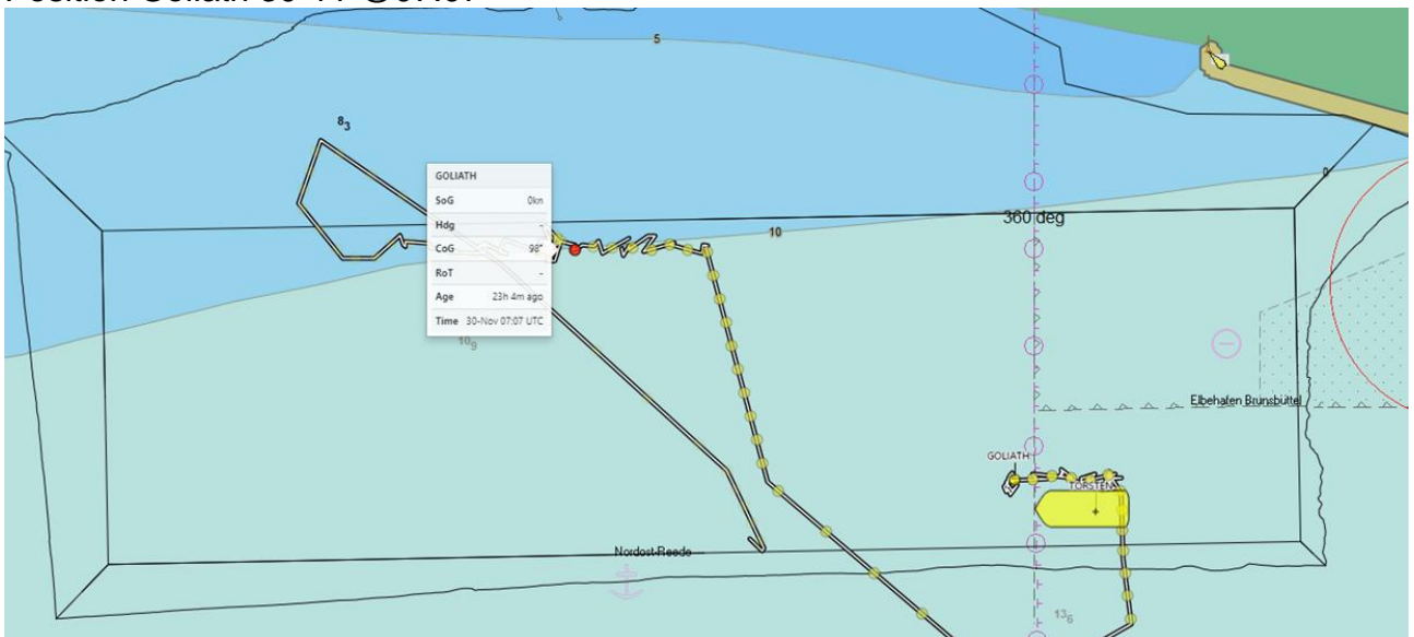
Bild Position Goliath 30.11. 07:07 1

The above shows that we have not moved in the night period of 29-11 to 30-11